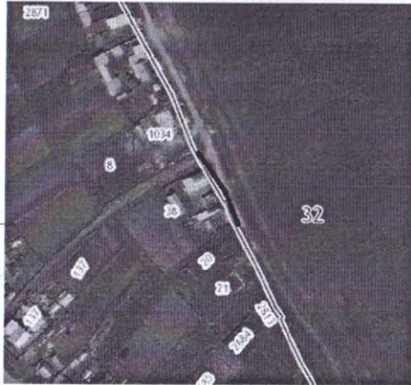
Схема предполагаемых к использованию земель или части земельного участка